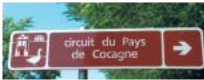
Le Comité Départemental du Tourisme vient de baliser un nouveau circuit touristique : "Pays de Cocagne". Itinéraire pour découvrir notre région.

Soyons honnêtes, ils aiment beaucoup, mais alors vraiment beaucoup, notre gastronomie , nos produits du terroir et ils ont bien raison !