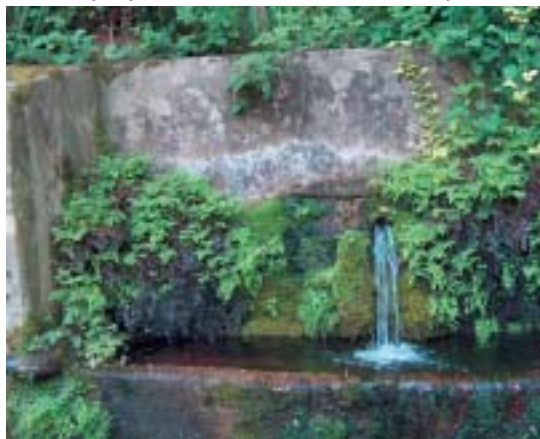
Fontaine - L'Albarède

Une réunion publique pour rendre compte de ce travail a eu lieu le mercredi 16 juin à 20h30 à la salle des fêtes de St Paul Cap de Joux. La liste d'actions validée sera alors soumise aux élus lors d'un prochain conseil de communauté.