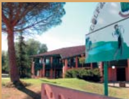
Golf des Etangs