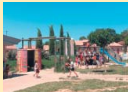
C.L.A.E. - Vielmur

Créé en 1998 grâce à une volonté municipale, le CLAE avait pour mission l'accueil des enfants de la commune de Vielmur en temps péri-scolaire et vacances. L'année suivante, il s'agrandit en ouvrant un point d'accueil à St Paul et devient intercommunal, avec le partenariat de la Communauté de Communes du Pays d'Agout. Dès lors, le CLAE ne cesse de se développer en ouvrant sur St Paul pendant les petites vacances (pas de ramassage).